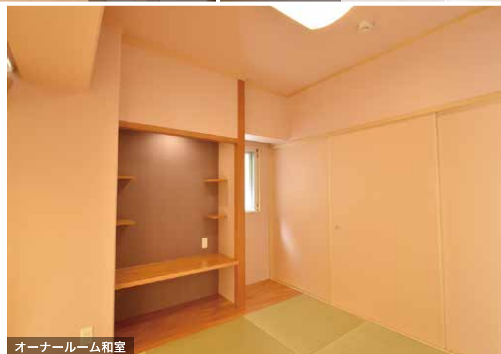
オーナールーム和室

【外観エントランスドア】鮮やかな白いエントランスドアが視線を惹きつけるファサードデザイン。周りをレンガ調の壁面で構成することで、ただ明るくだけでなく、高級感を演出し、建物の質を高めています。【オーナールーム LDK】ピンクとベージュの優しい色彩で構成された空間は、そこにいてだけで温もりを感じさせてくれる安らぎの空間となっています。【オーナールーム玄関】ステンドグラスの建具が印象的な玄関ホール。上品な花柄のアクセントクロスは空間の質を高め、暖かい色彩空間は帰宅時にリラックスできるようなデザインとなっています。【オーナールーム洋室 / 寝室】双方共に、グリーン系のアクセントクロスが施され、健康と癒しを意識させてくれる空間デザインの居室。梁と壁面に大きめな曲線を用いることで、殺気の発生を防ぎ、安心感や寛ぎのイメージをプラスしています。【オーナールーム和室】空間全体を構成するピンクベージュのクロスは LDK と同じですが、背面に紫色のアクセントクロスを用いた祭壇があることで、神聖な雰囲気がプラスされ、落ち着きのある空間となっています。