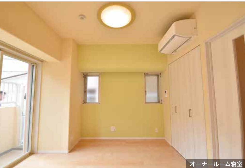
オーナールーム寝室