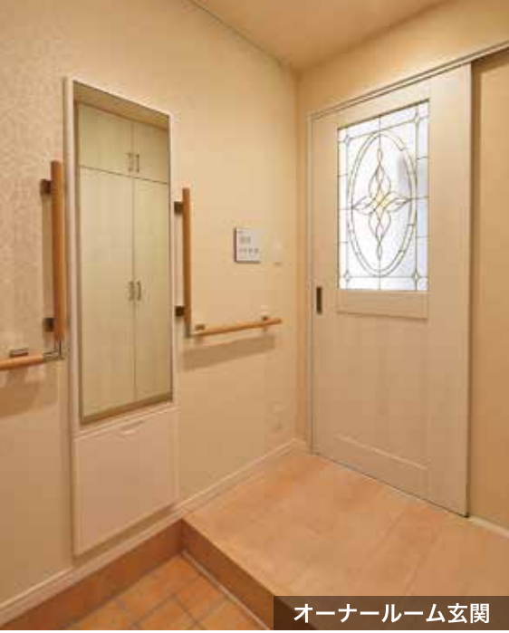
オーナールーム玄関